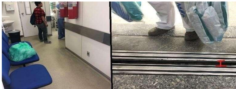
Figura 4. Acesso à Unidade A da Maternidade e desnível do elevador. (Autores, 2019)

e/ou hospitalares, assim todos elevadores transportam pacientes, acompanhantes, funcionários, e também os lixos.