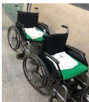
Figura 3. Cadeiras de rodas do setor. (Autores, 2019)

Além disso, com as observações abertas verificou -se que equipamentos só são limpos quando está visivelmente sujo (com manchas), e a troca do pano na cadeira de rodas também só é feita quando está muito sujo com manchas escuras ou quando tem sangue da paciente, também observou-se as condições das cadeiras de rodas, que estão enferrujadas, sujas e com o apoio de pés quebrados, e nenhuma tem suporte para soro ou outro medicamento, como mostra a Figura 3.