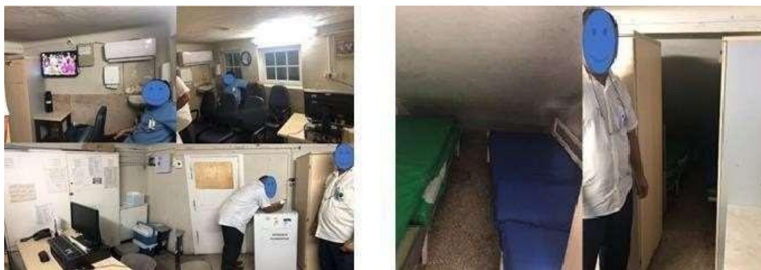
Figura 2. Sala do setor dos maqueiros e local de descanso dos maqueiros (Os autores, 2019).

Além disso, com as observações abertas verificou -se que equipamentos só são limpos quando está visivelmente sujo (com manchas), e a troca do pano na cadeira de rodas também só é feita quando está muito sujo com manchas escuras ou quando tem sangue da paciente, também observou-se as condições das cadeiras de rodas, que estão enferrujadas, sujas e com o apoio de pés quebrados, e nenhuma tem suporte para soro ou outro medicamento, como mostra a Figura 3.